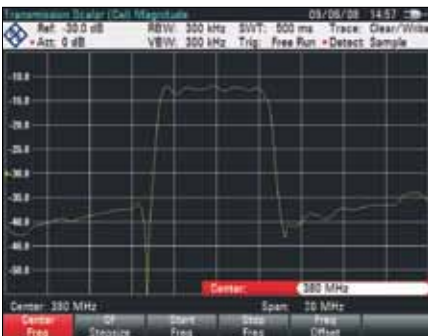
Скалярные измерения передаточных характеристик