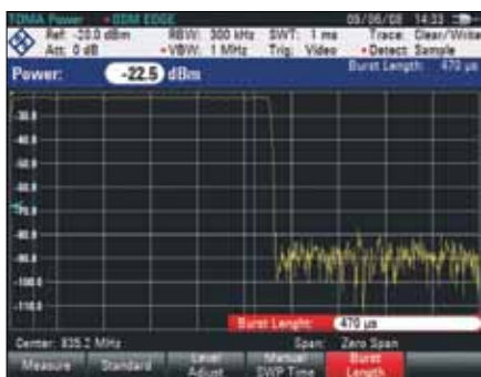
Измерение мощности TDMA