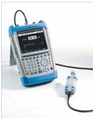
R&S®FSH и датчик поглощаемой мощности R&S®FSH-Z1

Опции FSH-K50E и FSH-K51E добавляют возможность наблюдать диаграмму созвездий различных каналов, производить сканирование эфира на наличие сигналов различных базовых станций (до 8 станций), с отображением мощности канала синхронизации и Cell Id каждой соты. Также доступна индикация использования каналов.