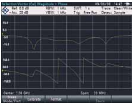
Векторный анализ электрических цепей: отображение амплитуды и фазы