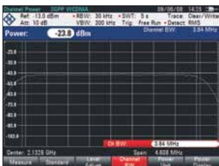
Измерение мощности в канале