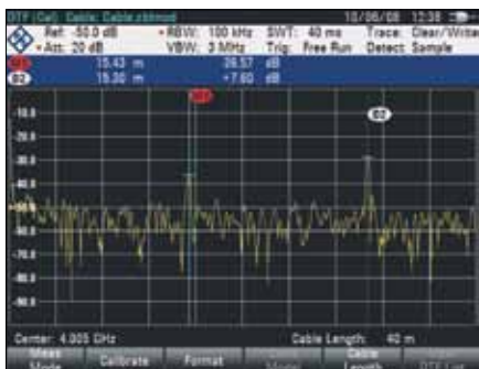
Измерение расстояния до места повреждения (DTF)