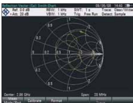
Векторный анализ электрических цепей с применением диаграммы Вольперта-Смита