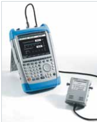
R&S®FSH и направленный датчик мощности R&S®FSH-z44